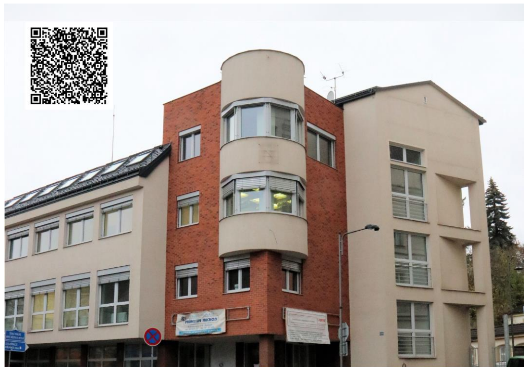
Budova v ulici Zámecká 1845

10. 12. 2018 – omezený provoz v budově Palachova 11. 12. 2018 – omezený provoz v budově Palachova 12. – 14. 12. 2018 – zavřeno stěhování 17. 12. 2018 – otevřeno v nové budově Zámecká Bližší informace: Bc. Pavel Schuma, tel. 736 613 419