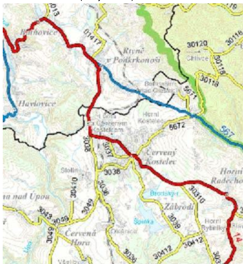
Obrázek 1 Silniční síť

Dopravní infrastruktura v návrhu Návrh ÚP Červený Kostelec je navržena invariantně. V rámci návrhu územního plánu jsou navrženy následující stavby dopravní infrastruktury: