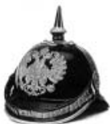
Helma rakouského četnictva (tzv. piklhaubna)

Ve větších městech byla pro dohled na veřejný pořádek zřízena městská policie. Také Náchod měl od počátku 20. století vlastní policejní sbor, který dbal na to, aby byl pořádek a klid v ulicích, aby se dodržoval tržní řád při týdenních a výročních trzích, aby byl klid v hospodách, aby se dodržovala uzavírací doba a podobně. Obecních policajtů bývalo v období I. republiky 10–12 a oblečení byli v tmavomodrých uniformách s čepicí ozdobenou městským znakem. Strážníci, která měla dvě místnosti, měli hned vedle radnice, v přístavbě hlavní budovy do Radniční ulice. Z ní byl vchod přes malý dvorek do obecní šatlavny, kam dávali provinilce tzv. „za katr“. Kromě toho byl v Náchodě ještě ponocný, tj. noční stráž a hlídač parků, který nosil na saku odznak přísežné strážce. Ten procházel po zámeckém kopci, v parku u kostela sv. Michala a u nádraží a dohlížel na to, aby zde byl klid, aby nikdo nepoškozoval lavičky, zábradlí a stezky a netrhal květiny.