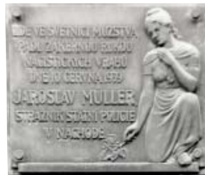
Pamětní deska na bývalé budově české státní policie v Hrašeho ulici.