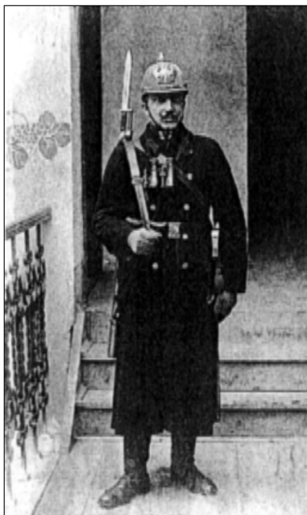
Rakouský četník z přelomu 19. a 20. století