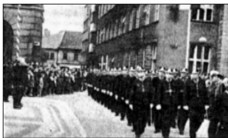
Převzetí městské stráže v Náchodě státní policií a přísaha