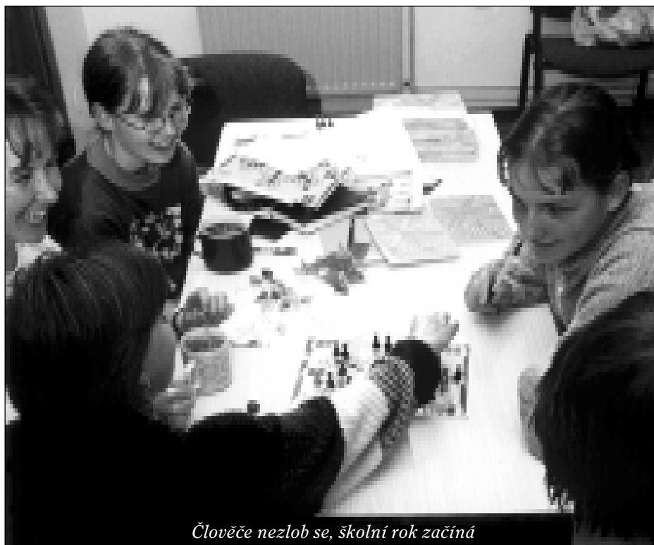
Člověče nezlob se, školní rok začíná