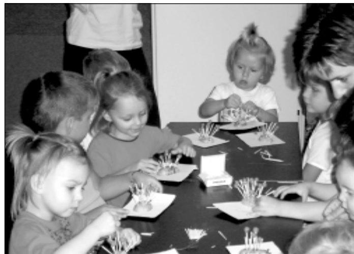
Ukázka činnosti dětí při jedné z hodin, která nese výstižný název Šikovné ručičky. Toto setkání bylo pojmenováno Jak se ježci připravují na zimní spánek.