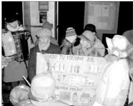
Popis foto: 75 let zavedení elektřiny v Malé Čermné.