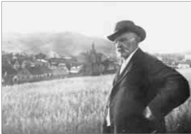
Mistr Alois Jirásek (1851–1930)