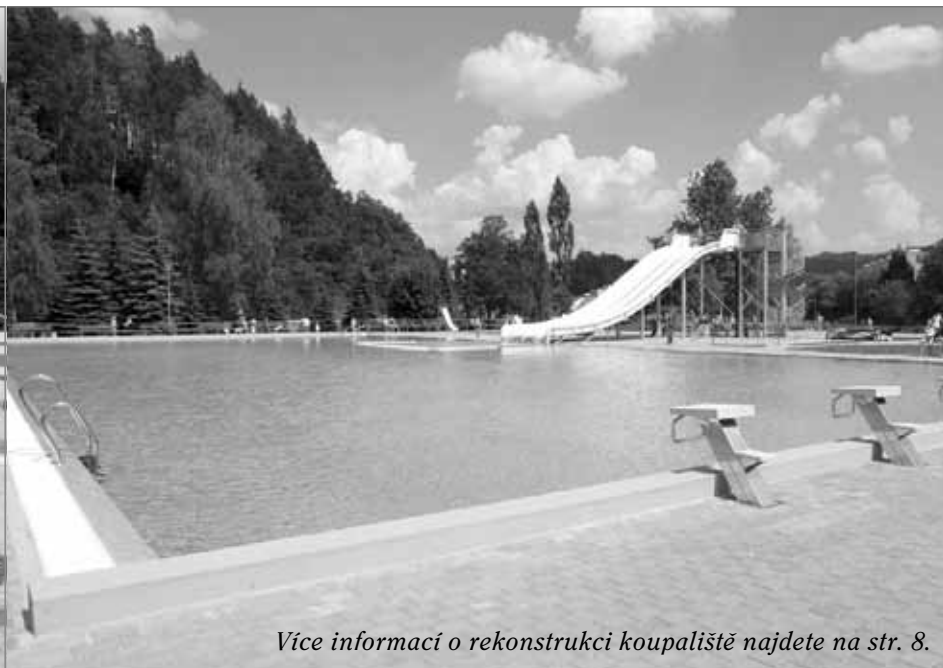
Více informací o rekonstrukci koupaliště najdete na str. 8.