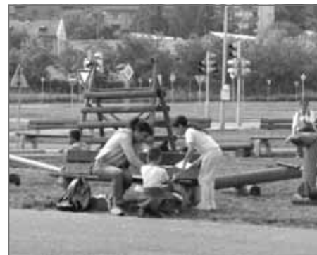
Paní Irena Rácová rozdává na stanovišti razítko za namalování obrázku

Dne 1. 6. proběhla na dopravním hřišti v Bělovsi oslava Mezinárodního dne dětí. Program se soutěžemi byl zahájen v 15 hodin. Každé z příchozích dětí, které chtělo soutěžit o ceny, dostalo očíslovanou kartičku, se kterou se prokazovalo na každém z osmi stanovišť se soutěžními disciplínami. Za každý splněný úkol dostalo na kartičku razítko. Ten, kdo splnil všechny úkoly a předložil kartičku s osmi razítky, mohl si jít vybrat drobnou cenu. Soutěží se zúčastnilo 114 dětí. Celkem se akce zúčastnilo asi 200 osob (dětí i dospělých, kteří dělali dětem doprovod). Ke zdárnému průběhu akce přispělo nejen nádherné počasí, ale i sponzoři, kteří na tento den věnovali občerstvení. Akci podpořili a velké poděkování patří: městu Náchod (jmenovitě terénním sociálním pracovníkům p. Šenkové a p. Vargovi), Kulturní a sportovní nadaci města Náchoda, Pivovaru, a. s. Náchod, Pekařství U ZVONU, firmě LEPŠ Kamenice, s. r. o. a firmě Skalicičan, a. s. Radka Zelená