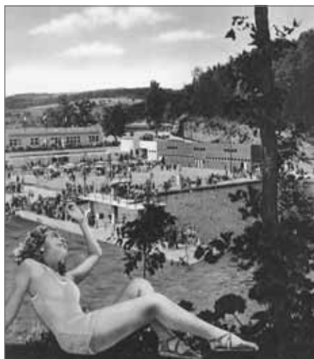
Propagační obrázek Koupaliště Jiráskova krajina z doby těsně po válce

ál byl oplocen a nazván v duchu tehdejší mentality Koupaliště Jiráskova kraje. Stej- ně moderní byly veřejné městské lázně, zřízené v nové budově Městské sportitel- ny na náměstí, v jejím zadním traktu s vchodem z Hrašeho ulice. V lázních byl nejen krytý plavecký bazén s přihříváním vodou, ale i parní a vanové lázně, svého času velmi intenzivně využívané.