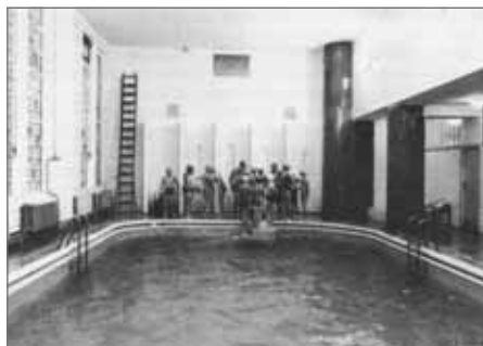
Bazén městských lázní v budově Městské sportovní ve 30. letech