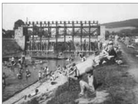
Lázeňské koupaliště v Bělovsi ve 30. letech