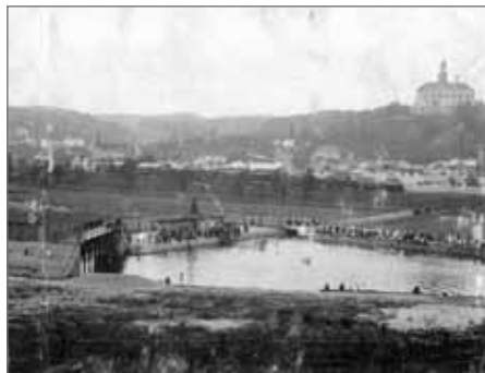
Slavnostní otevření plovárny na Metuji roku 1916