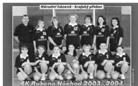
Oddíl národní házené SK Rubena Náchod v současnosti.