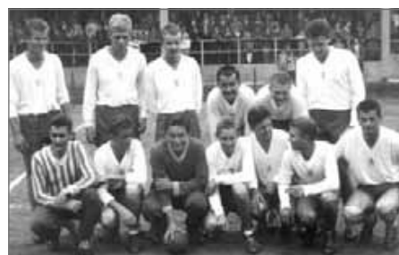
Začínající družstvo Rubeny Náchod v roce 1962