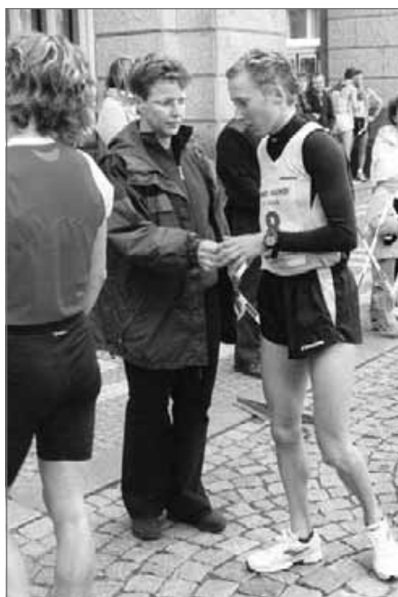
Náchodský zpravodaj říjen 2007