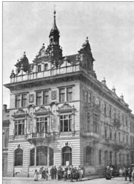
Všeobecná živnostenská záložna v Náchodě z r. 1902