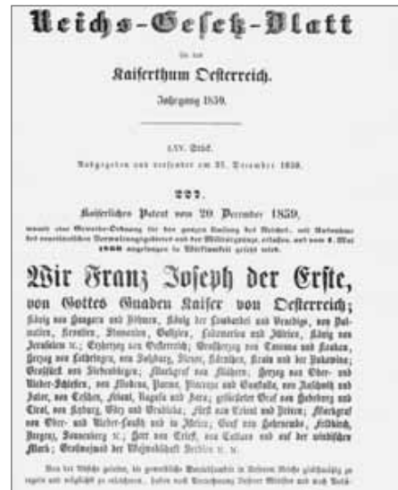
Živnostenský řád vydaný císařským patentem č. 227 z 20. 12. 1859

bylo žádoucí, aby je bylo možno provozovat jen na základě zvláštního státního povolení – koncese. Na jejich vydání nebyl právní nárok. Koncesované živnosti byly sice v živnostenském řádu uvedeny výslovně a taxativně, ale ministr obchodu byl zmocněn vy-