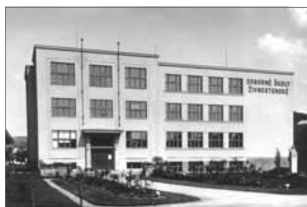
Živnostenská škola v Náchodě z r. 1931

hlásit nové, pokud by to vyžadovaly veřejné zájmy, nebo naopak mohl určité živnosti koncese zprostit (jednalo se např. o živnost hostinskou a výčepnickou, tiskařskou aj.). Živnosti řemeslné byly charakterizovány jako živnosti, při nichž jde o zručnost, která vyžaduje vzdělání v živnosti vyučením a delší zaměstnání při ní. I jejich seznam byl od novely v roce 1907 určen přímo zákonem. Živnosti svobodné byly všechny živnosti, které nebyly prohlášeny za řemeslné či koncesované. K nastoupení živnosti svobodné a koncesované stačilo podání ohlášky příslušnému úřadu, pokud ohlašovatel splňoval zákonné požadavky. Těmi byly jednak požadavky všeobecné, které musely být splněny u každé živnosti (např. způsobilost k právním úkonům), a zvláštní požadavky, které byly konkrétně určeny pro jednotlivé živnosti.