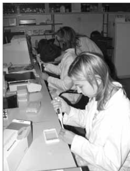
studenti nanášejí bílkoviny na povrch mikrotitračních destiček

Během dalších návštěv si budeme moci vyzkoušet i takové „lahůdky“, jako je například izolace nukleových kyselin, práce s fluorescenčním mikroskopem či metoda PCR (polymerázová řetězová reakce), která umožňuje namnožení předem daných úseků DNA. Že naše studenty „vědecká“ práce zajímá, lze vyvodit i z toho, že celý kurz absolvují během svého volna, o víkendech. Mají tak možnost získat mnoho nových zkušeností a poznatků, které budou moci využít během studia na vysoké škole