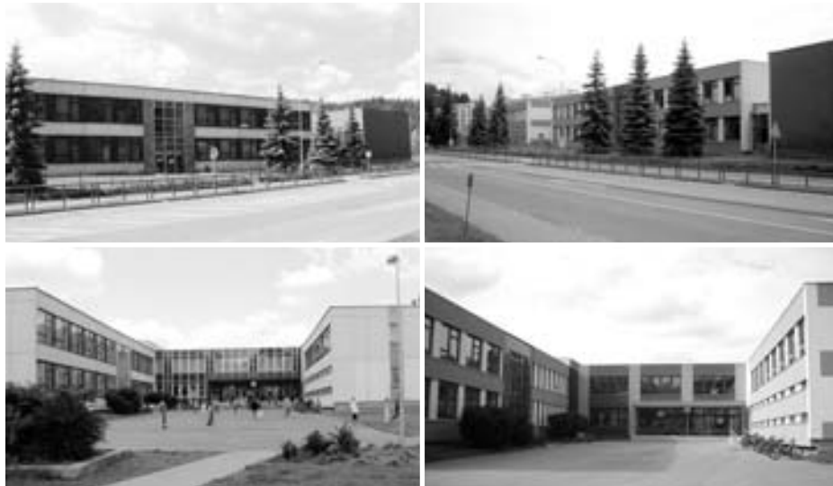
ZŠ před rekonstrukcí (fotografie vlevo) a po rekonstrukci (vpravo)

V Hradci Králové najdete kancelář inspektorátu práce v ulici Říční 1195, kde jsou vám k dispozici v pondělí a ve středu od 8 do 17 hodin. Tel. č. 495 217 494.