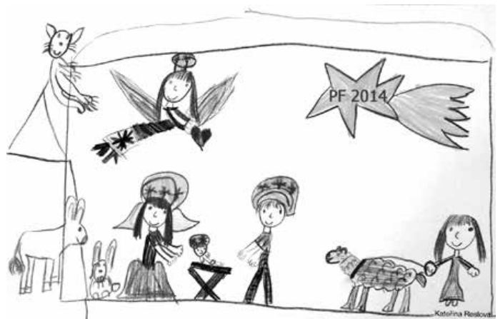
Pohodu a radost nejen o Vánocích přeje Městská knihovna Náchod

Podrobné informace o všech akcích knihovny najdete na plakátcích a na www.mknachod.cz . (Vo)