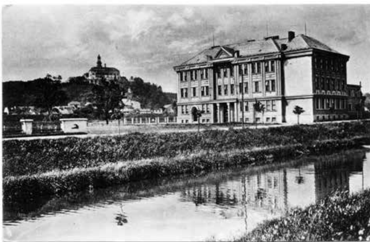
Náchodská obchodní škola z roku 1926

Jednalo se o dvoupatrovou budovu s valbovou střechou na půdorysu písmena F spojenou chodbou s jednopatrovou vilou ředitele. Architektonicky budova vychází z tzv. národního slohu ovlivněného stylem art deco, novoklasicismem i kubismem. Symetrické hlavní průčelí obrácené k jihozápadu člení výrazná římsa nad přízemím, kterému dominují tři půlkruhem zaklenuté portály (jeden slepý), před hlavním vchodem je závěťří nesené dvěma štíhlými pilíři s mohutnými hlavicemi. Obě patra zakončená mohutnou hlavní římsou zdobenou obloučky jsou členěna výraznými lizénami, zapuštěná střední část vrcholí antickým štítem (tympanonem) s mohutnými akroteriiemi (nárožní ozdobou). V suterénu měly být sklepy pro uhlí a kotelna pro ústřední topení. Tři místnosti měly v létě sloužit jako noclehárna pro turisty. V přízemí se plánoval zdobný vestibul, byt pro školníka, ředitelna, kabinet a učebna chemie, v prvním poschodí sborovna, dvě knihovny, dva kabinety (v prvním patře ředitelské vily), místnost pro přespolní žáky a tři učebny pro dívky. Druhé patro obsahovalo dvě písárny, učebnu jazyků a dvě učebny pro chlapce. Ve dvorním křídle bylo monumentální dvouramenné žulové schodiště se zdobným zábradlím. Podmínkou bylo, že přízemí budovy bude nejméně 1,8 metrů nad úrovní nábřeží. Z důvodu stavby Okresní správní komise